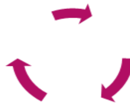
▲ Gráfico N° 1 Nombre del gráfico Elaborado Por: Fuente:

La manera en que se deben presentar los gráficos es la siguiente: (entiéndase por gráfico a todo dibujo o diagrama que posea líneas recuadros o flechas) si estos son a colores deben ser claros y bien diferenciados para evitar confusión si se los fotocopia.